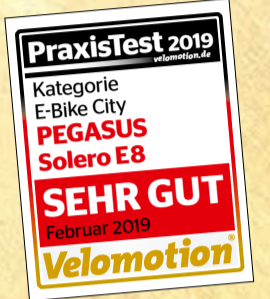
PEGASUS Solero E8 E-Bike 28 Zoll, Art.Nr.: 794-00945