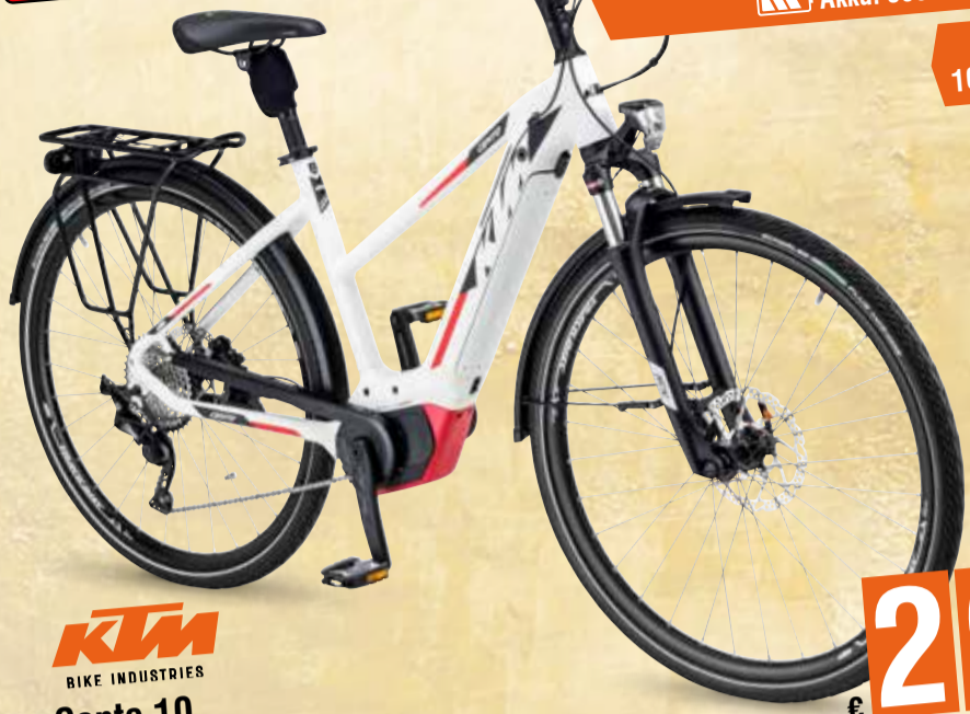
KTM BIKE INDUSTRIES Cento 10 E-Bike 28 Zoll, Art.Nr.: 799334236

Leichter Aluminium-Rahmen, blockierbare SR Suntour NCX-D Federgabel, Shimano hydraulische Scheibenbremsen, leichte Schwalbe Energizer Plus E-Bike Bereifung, Ambrosio Track Disc Felgen, heller und vom Display aus bedienbarer LED-Scheinwerfer, LED-Standrücklicht, Racktime Systemgepäckträger, beleuchtetes BOSCH Induvia Display, abnehmbar