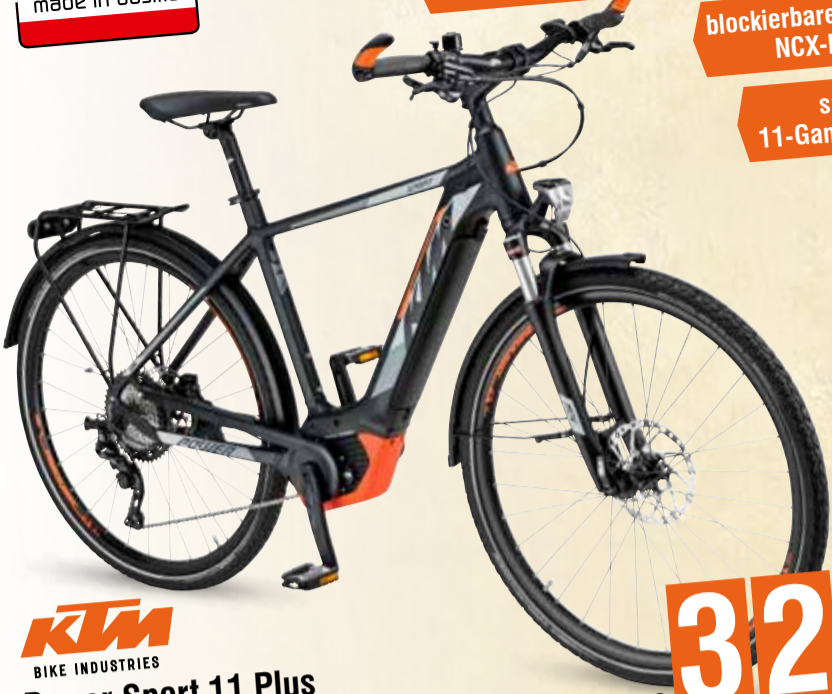
KTM BIKE INDUSTRIES Power Sport 11 Plus E-Bike 28 Zoll, Art.Nr.: 799330106

Leichter Aluminium-Rahmen, Shimano hydraulische Scheibenbremsen, Schwalbe Marathon Mondial Bereifung, Ambrosio Track Disc Felgen, heller und vom Display aus bedienbarer LED-Scheinwerfer, LED-Standrücklicht, Racktime Systemgepäckträger, beleuchtetes BOSCH KIOX Display, abnehmbar