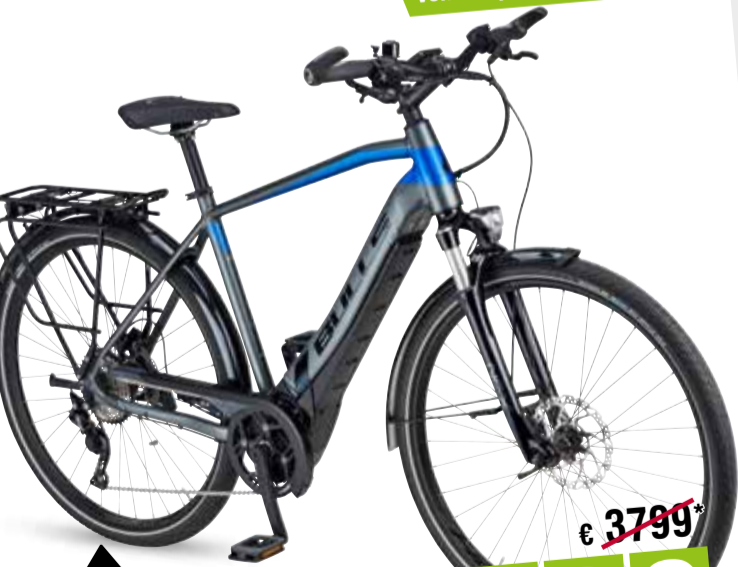
BULLS Lacuba EVO 25 E-Bike 28 Zoll, Art.Nr.: 797-43948

heller LED-Scheinwerfer vom Display aus bedienbar