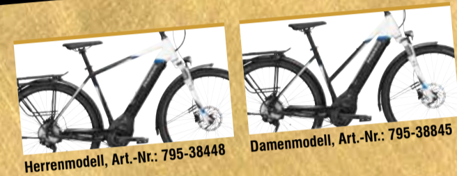
Herrenmodell, Art.-Nr.: 795-38448