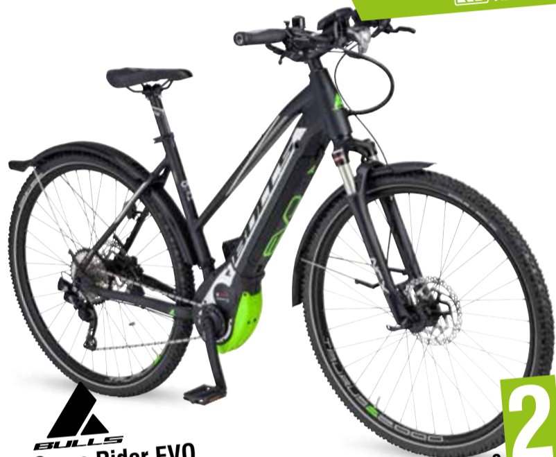
BULLS Cross Rider EVO E-Bike 28 Zoll, Art.Nr.: 795-84945

Aluminium-Rahmen, blockierbare SR Suntour Federgabel, Shimano hydraulische Scheibenbremsen, sportliche Schwalbe Smart Sam Bereifung, heller und vom Display aus bedienbarer LED-Scheinwerfer, LED-Standrücklicht, BULLS Sattel, STYX Sattelstütze, beleuchtetes BOSCH Intuvia Display, abnehmbar