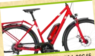
Damen E-Bike, Art.-Nr.: 794-00645