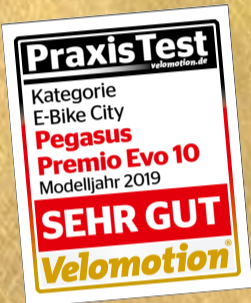
Damenmodell, Art.-Nr.: 795-38845