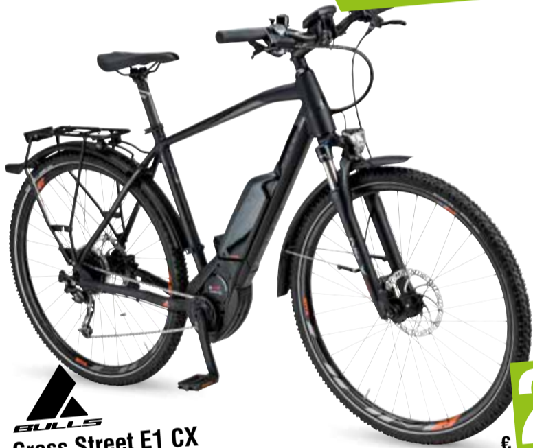
BULLS Cross Street E1 CX E-Bike 28 Zoll, Art.Nr.: 794-83848

Aluminium-Rahmen, blockierbare SR Suntour Federgabel, Tektro hydraulische Scheibenbremsen, Schwalbe Smart Sam Bereifung, heller und vom Display aus bedienbarer LED-Scheinwerfer, LED-Standrücklicht, BULLS Sattel, STYX Sattelstütze, beleuchtetes BOSCH Intuvia Display, abnehmbar